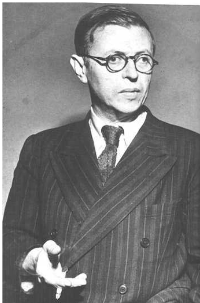
Портрет Ж.-П. Сартра, появившийся в Time magazine в 1946 г.